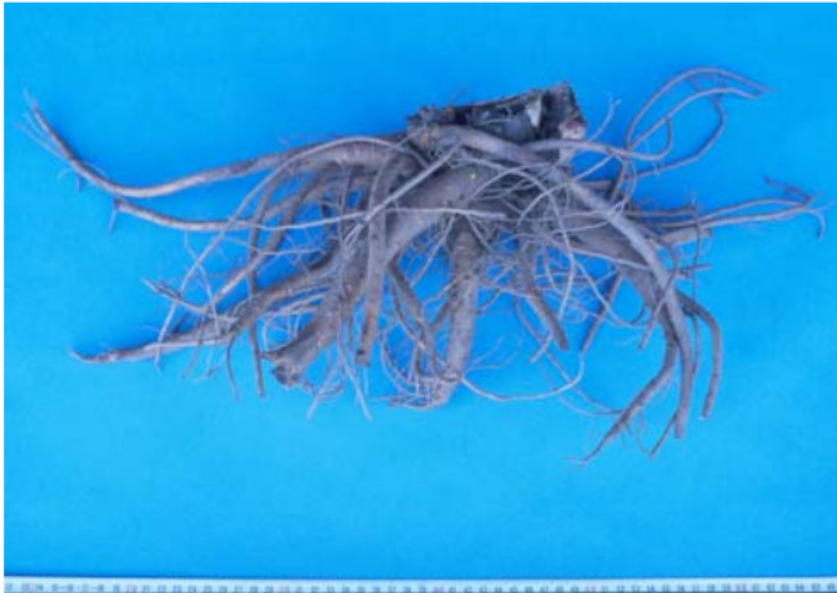
Abb. 8: Einjähriger Wurzelstock von Rheum palmatum