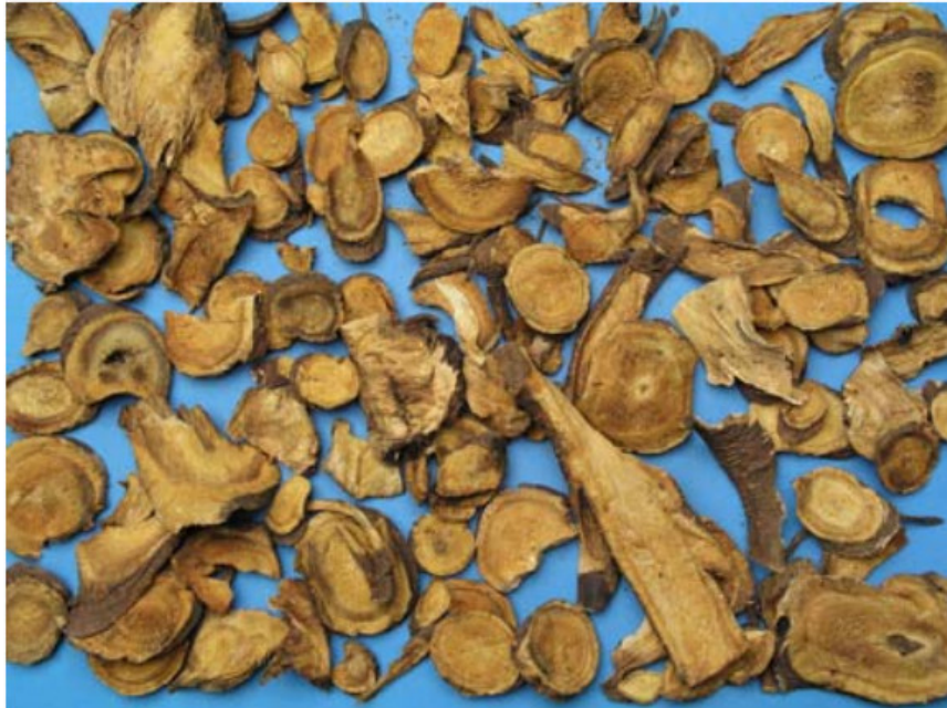
Abb. 10: Traditioneller Schnitt bei chinesischer Importdroge