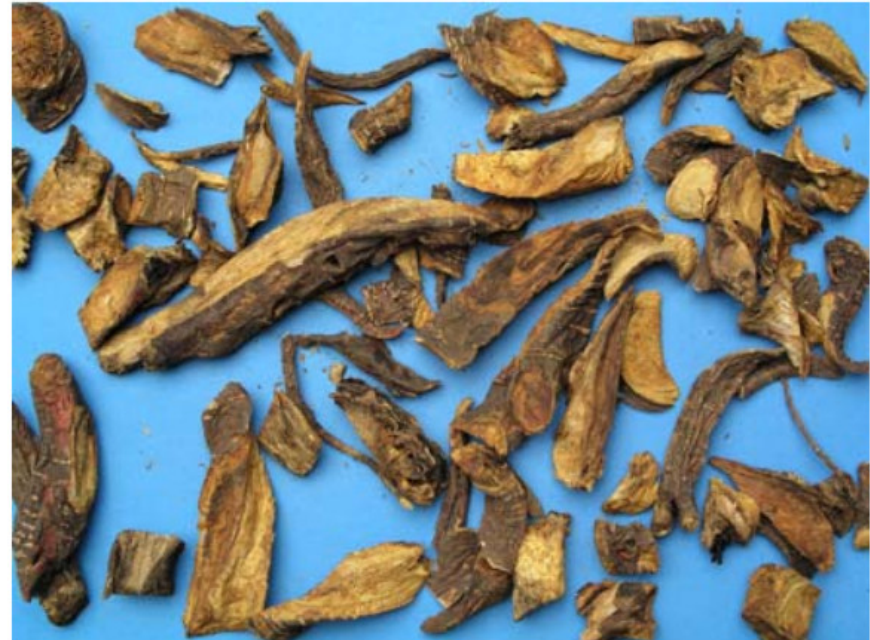
Abb. 11: Wurzeldroge aus Versuchsanbau