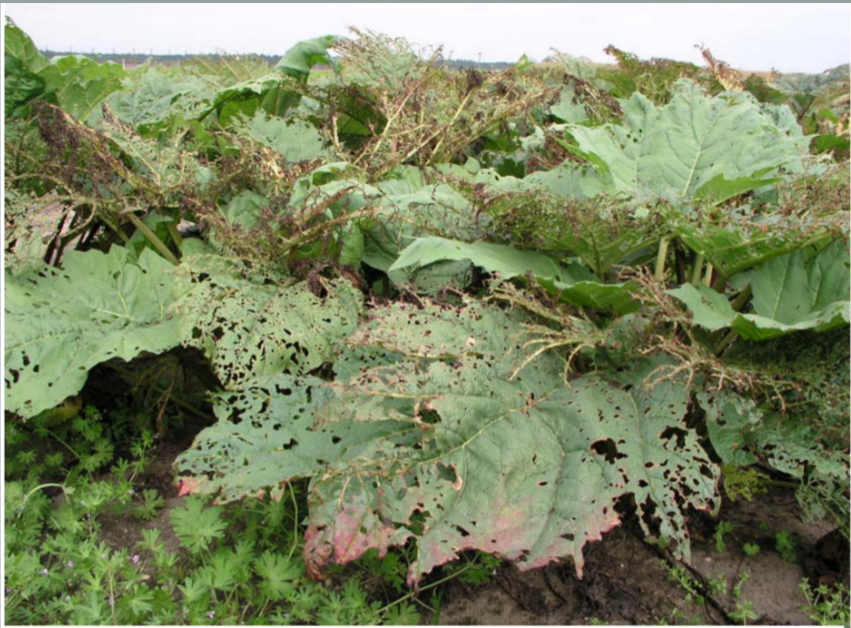
Abb. 7: Starker Befall mit Ampferblattkäfer (September 1. Vegetationsjahr)