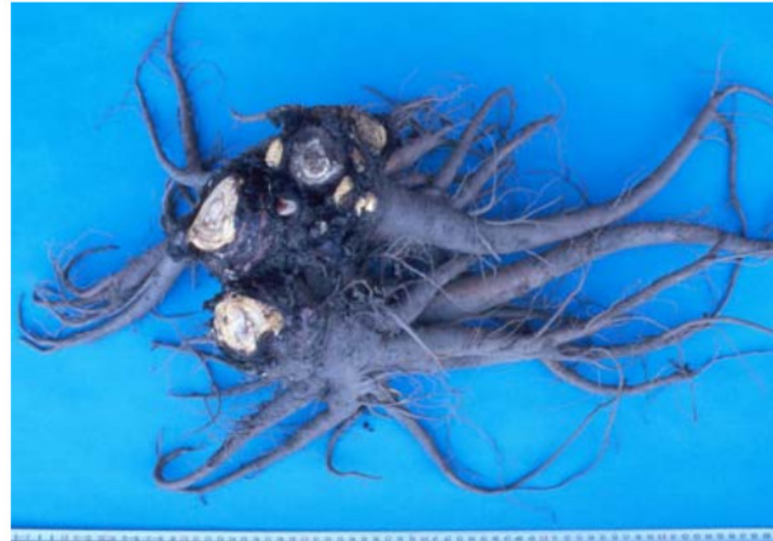
Abb. 9: Zweijähriger Wurzelstock von Rheum palmatum