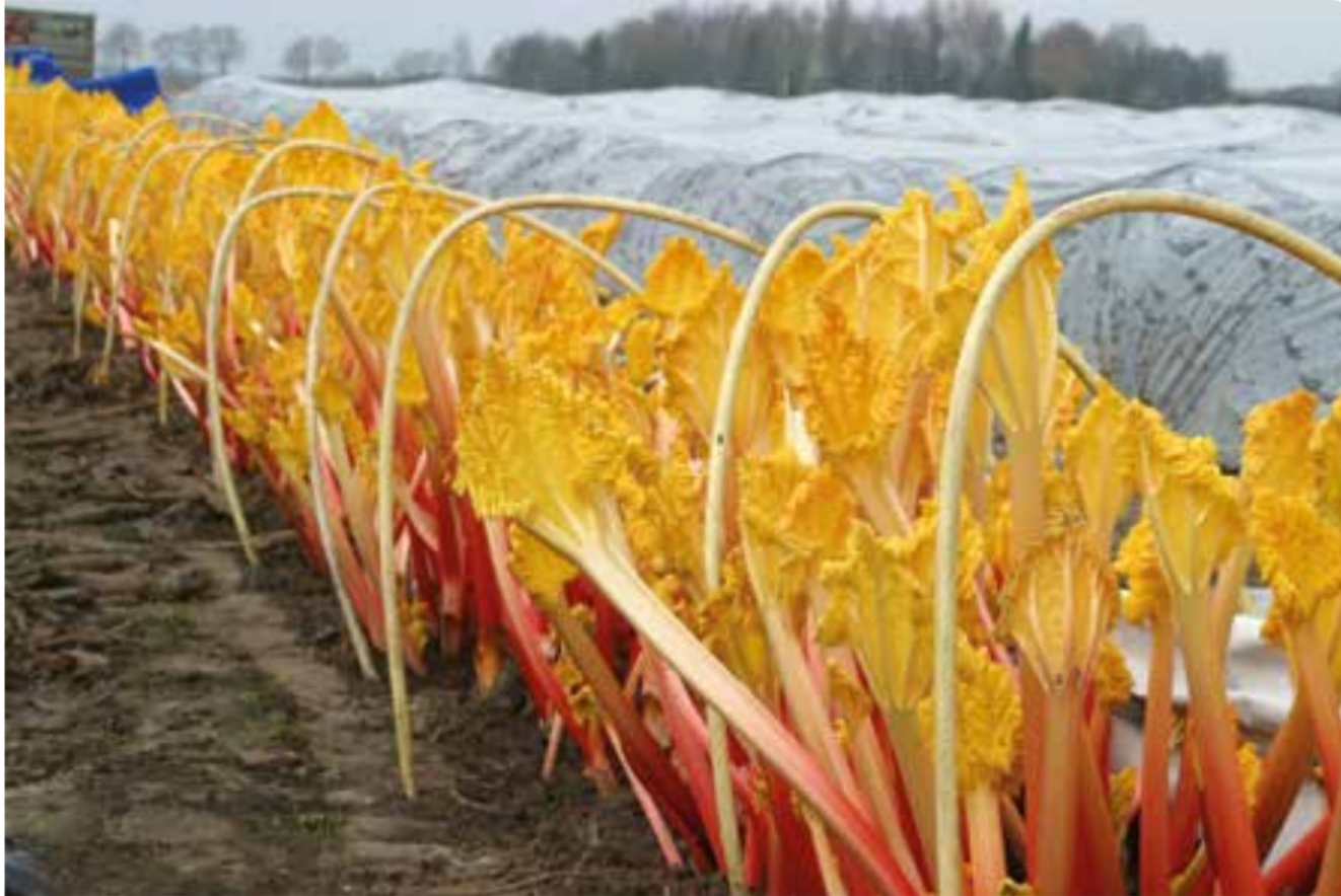
Abb. 73 Treibrhabarber unter Klein- tunneln mit Bodenheizung